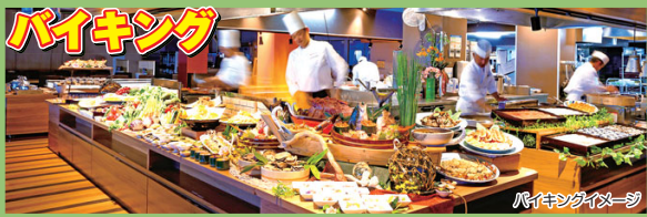
バイキングイメージ