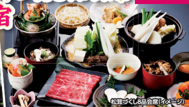
松茸づくし8品会席(イメージ)