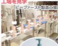
ピーファースト製造工場