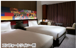
コンフォートツイン一例