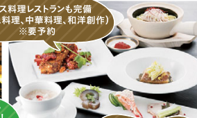
和洋中様々な料理を 楽しめるバイキング