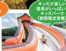
キッズが楽しい 遊具がいっぱい！ キッズパーク (期間限定営業)