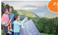
子供に大人気の 室内プール