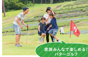
家族みんなで楽しめる！ パターゴルフ